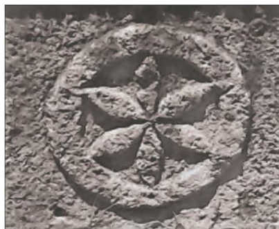
La Roseta Hexapétala The Six-petal rosette

Keywords: History, symbol, culture, identity, town