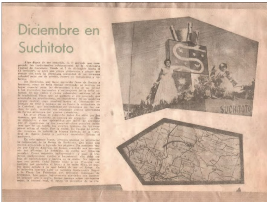
Figura. 3. Presenta un fragmento del filme “Universo Menor”

En la década de 1980, el cine crecía a grandes pasos, en especial en Estado Unidos era un referente del cine comercial en Latinoamérica. A nivel local, el desarrollo se dio a un ritmo muy lento. Un punto detonante en el cine local se vería perjudicado en gran manera por los movimientos sociales y conflictos internos que iban moldeando una larga y sangrienta guerra civil en El Salvador (Duran, Marroquín & Olmedo, p. 5). Ejemplo de ello, es el filme “ Universo Menor ” (ver figura 2 y 3). Filme que inicio en 1979, pero, debido al conflicto armado, Cotto dejo de producirla. El filme, tenía como objetivo dar a conocer las fiestas populares del municipio de Suchitoto. Y la denuncia de la construcción de la represa el Cerrón Grande. Denuncia que fue estéril. Ya que muchas personas fueron despojadas de sus tierras sin su consentimiento (Manuscrito de Cotto, 1979).