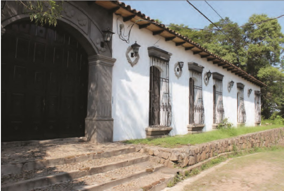
Figura. 6. Muestra la fachada principal de la Nave, que data a finales del siglo XIX