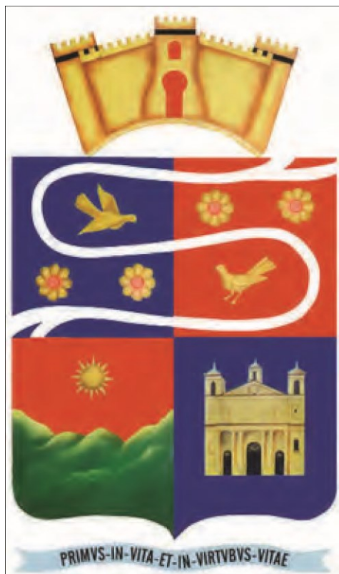
Figura 2. El diseño del escudo fue elaborado por el escritor, diplomático y poeta Manuel José Arce y Valladares en colaboración con el Sr. Alejandro Cotto en el año de 1958 (Manuscritos personales de Cotto, 1958).

Con la creación de símbolos locales según Vives (2012) estos constituyen unidades mínimas de información que van ligadas a la emoción que nos producen (Vives, 2012, p.1). Emoción que llevó a la realidad Cotto en el municipio de Suchitoto, por medio de la creación símbolos locales: el escudo, bandera e himno.