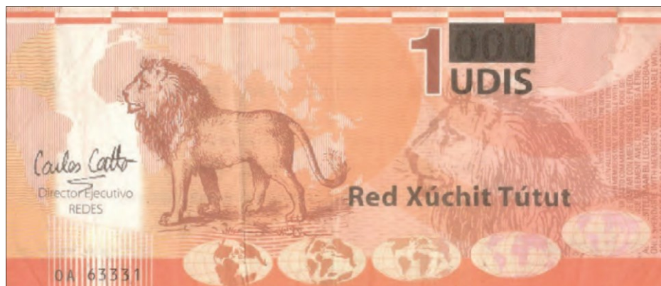
Figura 5. Muestra el lado anverso de la moneda (en papel) del municipio de Suchitoto.