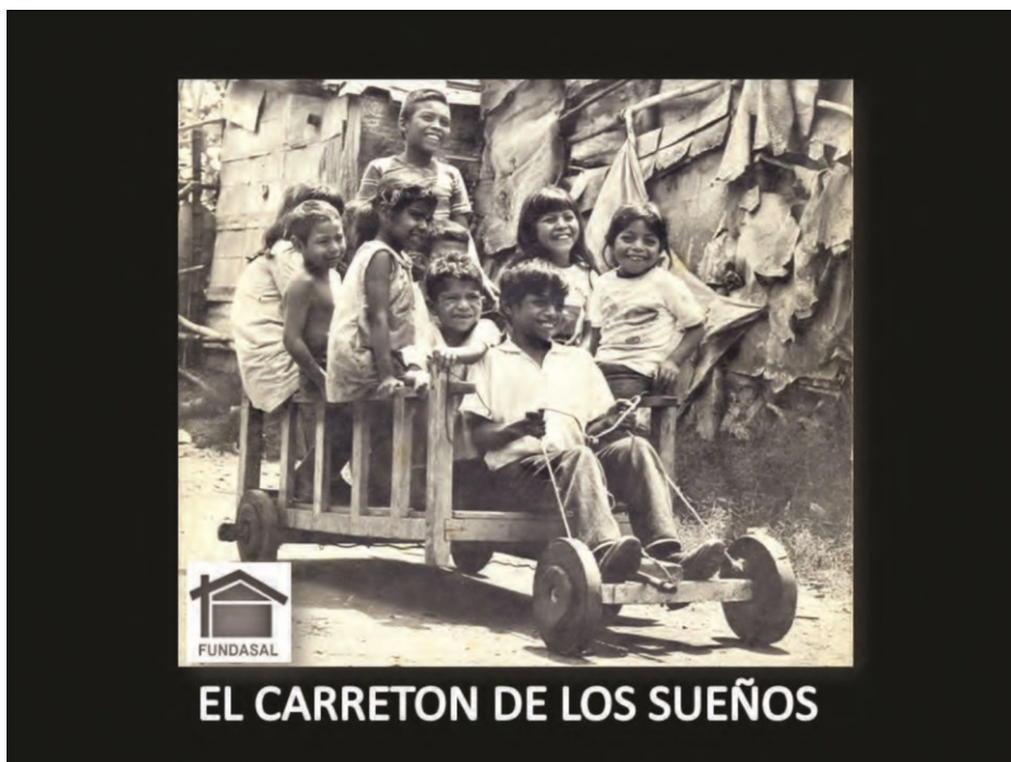
Figura 1. Imagen del filme “El carretón de los Sueños”.