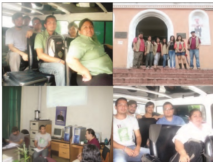
Figura 1. Conformación de equipos de investigación de la escuela de Antropología y planificación del proceso de proyección social.

La segunda forma de cómo se integran los grupos de proyección social es la más asertiva, y los estudiantes se comprometen a iniciar hasta terminar los procesos a largo plazo; sin embargo, hay que tomarle la palabra a la alumna citada en su recomendación y buscar más formas de convocar a los estudiantes para que experimenten dichos procesos.