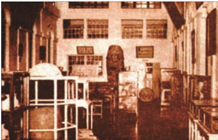
Imagen 1. Aspecto que ofrecía la exhibición permanente del museo nacional cuando se encontraba instalado la Finca Modelo a un costado de la ex Casa Presidencial.

El entorno cultural en el que se desarrolló el Dr. Guzmán pudo ser el germen inspirador para proponer, ante las autoridades estatales del momento, contar con un museo en nuestro país, que se consolidó el 9 de octubre de 1883, coincidiendo con lo que acontecía en Europa debido al surgimiento de muchos museos, promovidos por los cambios sociales que se impulsaron a través de las diversas expresiones artísticas y apertura de muchos espacios museísticos (Batres, 2013).