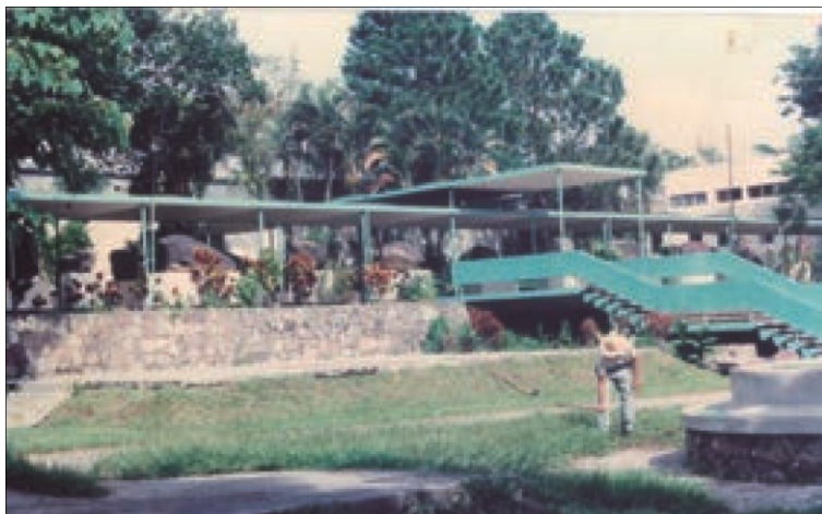
Imagen 3. Fachada principal del antiguo museo nacional ubicado en la avenida La Revolución de la colonia San Benito, en la que se observa el pasillo rupestre.

Este nuevo edificio también soportó las consecuencias del terremoto del 3 de mayo 1965; y durante el tiempo que estuvo habilitado para los servicios públicos también se sucedieron aspectos importantes en el devenir de su funcionamiento, pues a partir de principios de la década de los setenta se propician cambios institucionales, y en 1974 se crea la Administración del Patrimonio Cultural; se construye a su vez el edificio administrativo para el funcionamiento de su estructura técnica y administrativa, donde se ubicaban las siguientes unidades laborales: Departamento de Museos, Departamento de Investigaciones, Departamento de Sitios y Monumentos, además de un área administrativa, constituyéndose así en la columna vertebral de lo que a futuro sería el desarrollo de esta instancia estatal.