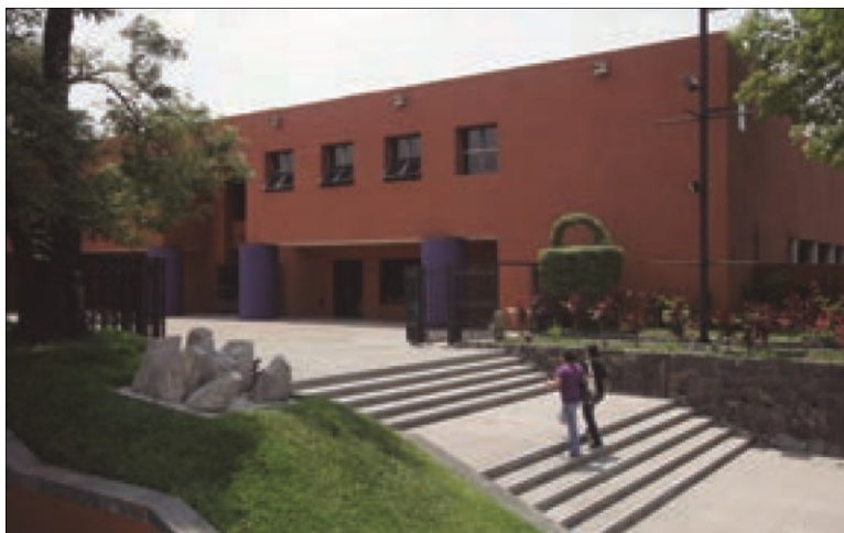
Imagen 9. El actual edificio del Museo Nacional de Antropología.

En las salas, en su nuevo planteamiento museológico y museográfico, la presentación de su discurso respondía a principios fundamentales de continuidad y discontinuidad asociados con la dinámica cultural y sus cambios reflejados en tiempo y espacio, tratando de mostrar las actividades del hombre en su entorno.