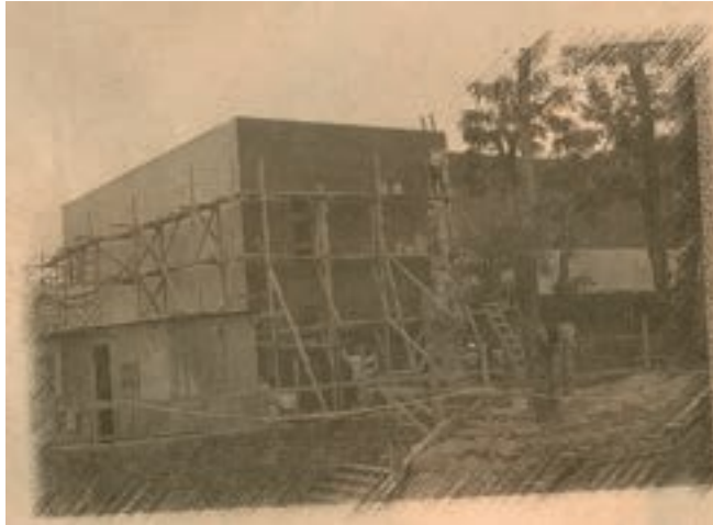
Imagen 8. El actual edificio del Museo Nacional de Antropología en proceso de construcción a finales de los años 90.

Se formuló una solicitud de apoyo a otras instituciones especializadas con este tipo de experiencias. Esta se obtuvo mediante una consultoría técnica de carácter internacional para contar con la presencia del arquitecto y museólogo Felipe Lacouture Fornelli, enviado especial del Instituto Nacional de Antropología e Historia de México, cuyas recomendaciones fueron incluidas en el desarrollo del diseño final del edificio.