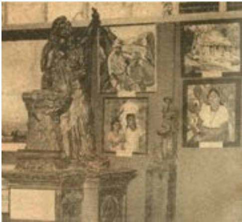
Imagen 4. Muestra de las colecciones que albergaba el museo nacional y que posteriormente se trasladaron durante la especialización temática a otros espacios de exhibición a finales de los años 60.