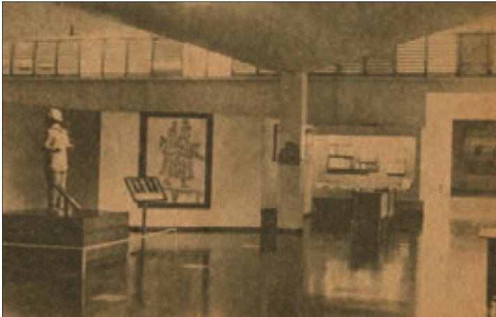
Imagen 6. Sala introductoria del antiguo museo nacional en la avenida La Revolución.

Esta se constituía en el área de ingreso al museo, ubicada en el área vestibular, y sus elementos de exhibición eran la maqueta del relieve topográfico de la República de El Salvador, que ubicaba algunos lugares culturales importantes, entre ellos los sitios arqueológicos, algunas iglesias y vestigios coloniales en nuestro país.