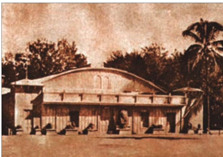
Imagen 2. La estela de Tazumal y algunos petrograbados adornaban la fachada de la Finca Modelo a principios de siglo XX.

Pocas son las referencias acerca de los antecedentes del museo nacional. Su historia se comienza a construir desde el primer espacio que ocupó, mencionándose que fue dentro del antiguo edificio de la Universidad Nacional, posteriormente se ubicó en diferentes espacios, entre ellos los siguientes: