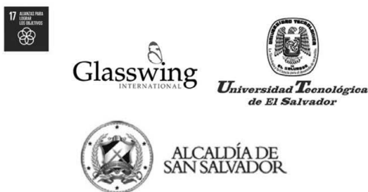
Figura 1. Instituciones interesadas en la ejecución del proyecto de urbanismo táctico en la calle Arce

La investigación se realizó desde el método cualitativo con enfoque descriptivo cuasi experimental (Hernández, Fernández y Baptista, 2003), ya que se buscó identificar los cambios de comportamiento —si los hubo— de los ciudadanos a partir de la observación de su andar sin contar con el control experimental completo (León y Montero, 2003).