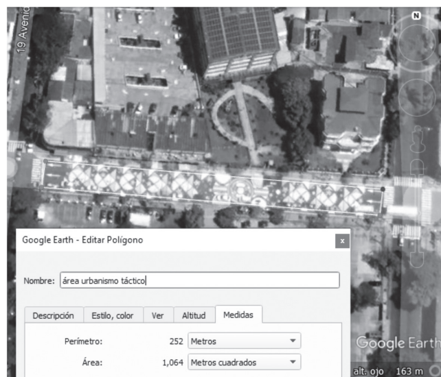
Figura 4. Área de intervención del proyecto

Nota. La figura muestra el perímetro y área en metros cuadrados del proyecto de urbanismo táctico en la calle Arce. Elaboración propia.