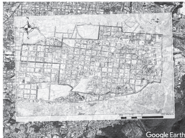
Figura 2. Área de intervención del proyecto urbanismo táctico, calle Arce

Ubicación del área (marcada con amarillo) por intervenir dentro del perímetro del centro histórico de San Salvador