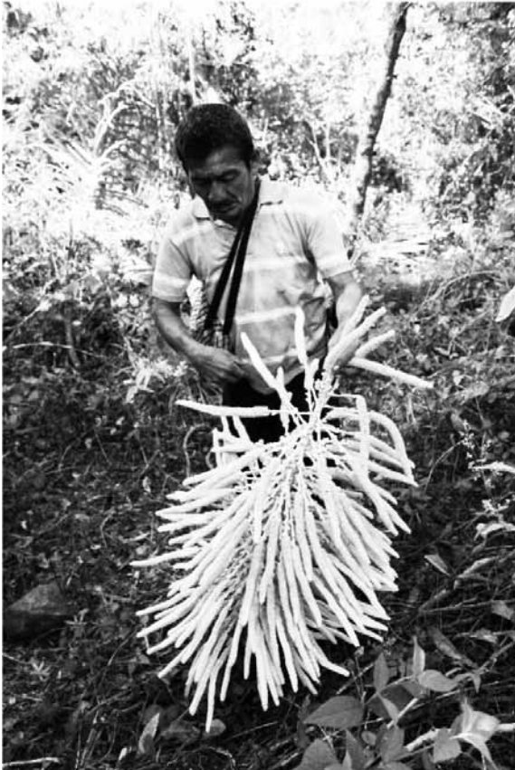
Figura 2. Cofrade sostiene una flor de corozo, obtenida en Santa Isabel Ishuatán.

un terreno laderoso se encuentran las flores de corozo. Se ingresa a través de veredas empedradas y muy boscosas, además hay mucho arbusto de ishcanal, que abunda en la zona.