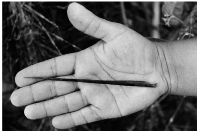
Figura 3. Espina de la palma de coyol, que llega a medir hasta 15 centímetros de largo.

La flor de coyol suele ser formada por granitos que revientan en diminutas flores, en cambio el corozo es una flor a manera de pétalos y que es la que más olor produce, además es que más crece dentro de la pacaya que la envuelve.