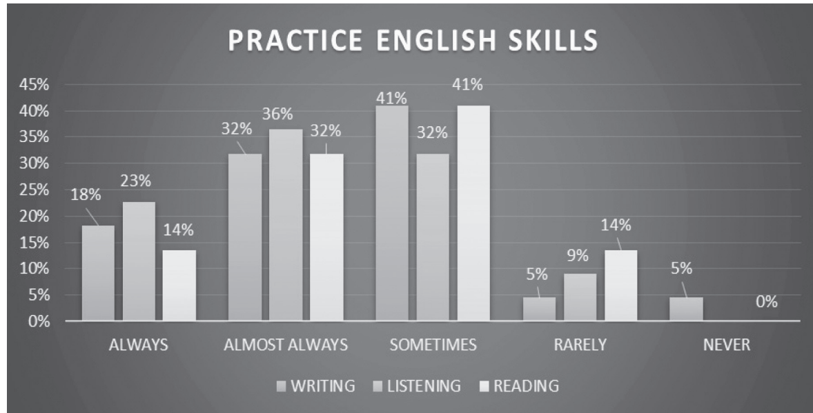
Figura 2. Práctica de inglés de los estudiantes

En cuanto a comprensión auditiva realizada, 23 % de los encuestados manifestaron que la frecuencia con que ejercitan su destreza de comprensión auditiva es siempre , mientras que un 36 % casi siempre practica la comprensión auditiva como parte de su estrategia de estudio o práctica del idioma inglés, para el desarrollo de competencias lingüísticas. El 32 % de los encuestados están en una frecuencia de algunas veces en cuanto a la práctica que realizan de la comprensión auditiva para desarrollar esa área de dominio del idioma.