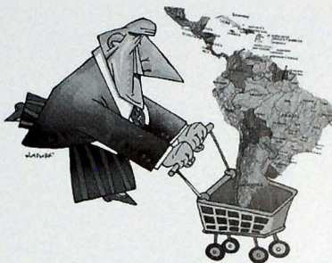
Ilustración: «Inversiones en Sudamérica», Pablo Blasberg.com

Un mecanismo arbitral que cumplió su objetivo en la consolidación de la zona de libre comercio y en el per-