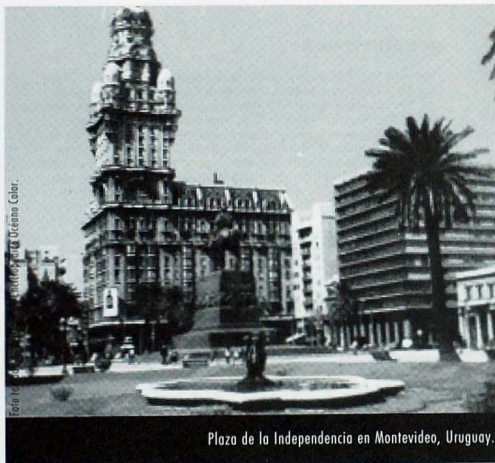
Plaza de la Independencia en Montevideo, Uruguay.

En este sentido, los presidentes del Mercosur, que asumen nuevos mandatos durante 1999 y en el primer trimestre del año 2000, toman la decisión de relanzar el proceso impulsando una tercera generación de reformas.